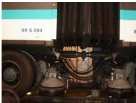
Vue générale sur 2 rames et leurs boggies