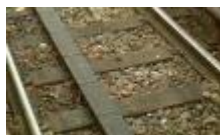
Exemple de Tapis sur voie