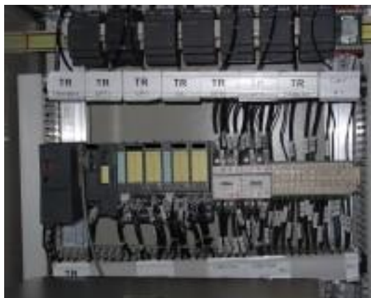
Automates situés dans l'armoire DOF1-Sol