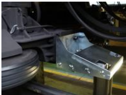
Prototype d'antenne DOF1-Bord fixé sur la boggie